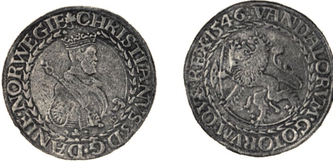
Norsk Daler 1546

Vi tager en anden god Daler fra Datiden, den norske fra 1546: