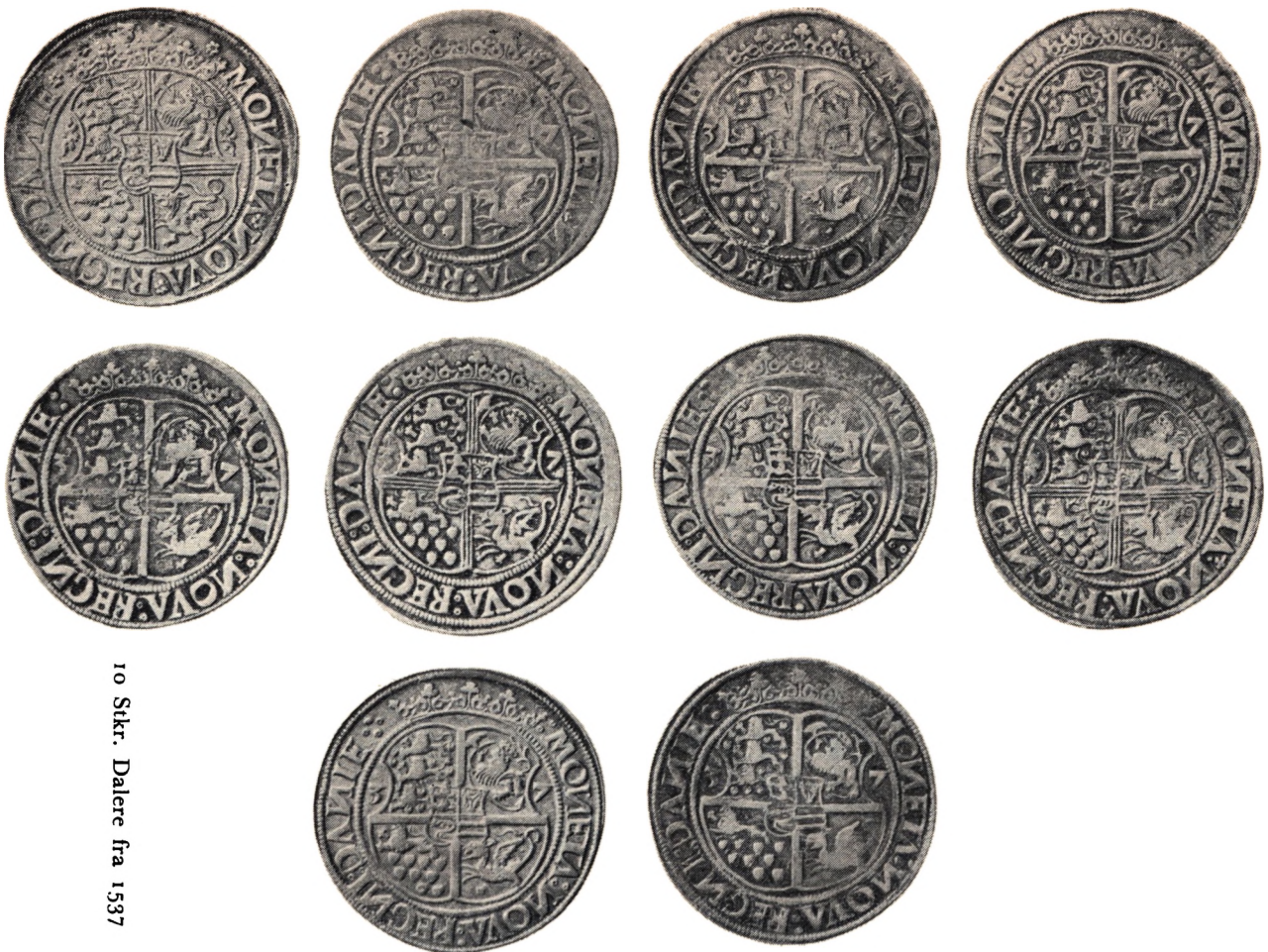
10 Siker. Dalarna fra 1537