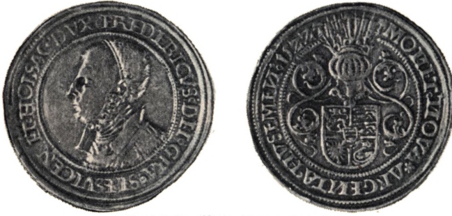
Dobbel M fra Husum 1522

Vægt er opgivet til 29,00 gr. i Stedet for 29,15 gr. Herefter opnaas et »Gennemsnit« paa 28,69 gr., der p. XX dog rundes opad til 28,75 gr. = 230 gr. paa den cølnske Mark.