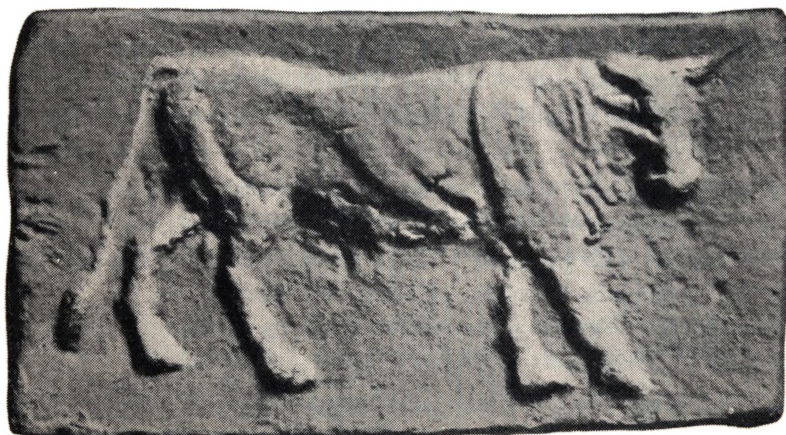
Kobbermønt fra Mellemitalien, 3-Hundredaarstallet før Chr.

Fra dette Udgangspunkt maa vi forudsætte, at det oprindelig va Meningen, at Metalstykket (Mønten) i sig selv skulde have den Værdi